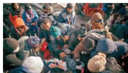
◆紐約有大批無家者在寒冷天氣下爭相領取分發的食物和衣服。

英國保險公司Agcas UK的最新調查發現，英國65歲以上的業主中，只有11.5%制訂了針對惡劣天氣引發危機的應急計劃，比率遠低於全國平均數23%，他們最擔心停電、鍋爐損壞和水管結冰。