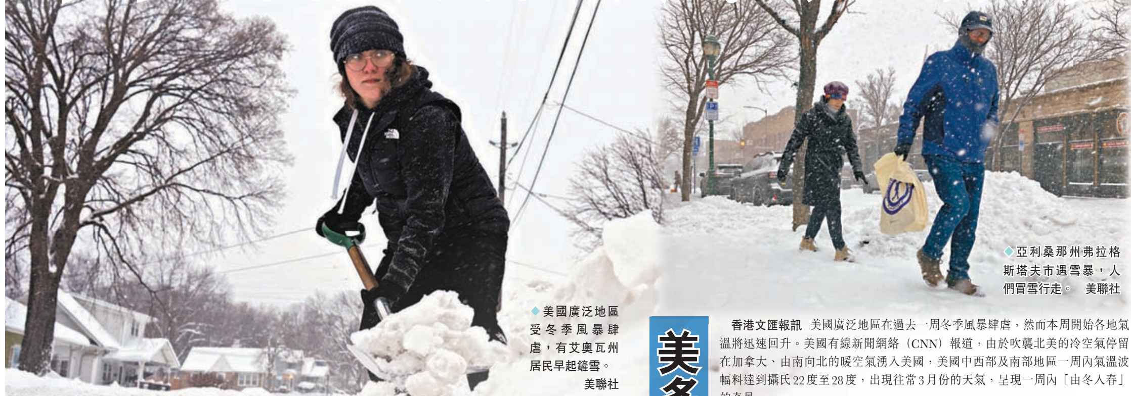
◆亞利桑那州弗拉格斯塔夫市遇雪暴，人們冒雪行走。