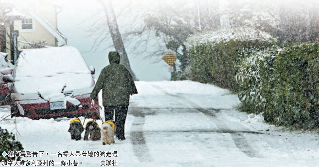
◆在降雪警告下，一名婦人帶着她的狗走過加拿大維多利亞州的一條小巷。

專家表示，嬰兒和老人由於難以維持體溫，且身體產生的熱量較少，患低溫症的風險較高。患有阿茲海默症的老人特別容易出現中度至嚴重低溫症，原因是他們可能無法評估自己是否感到不適或需接受治療。年幼兒童由於可能無法說出身體狀況，要診斷是否患低溫症也很困難。