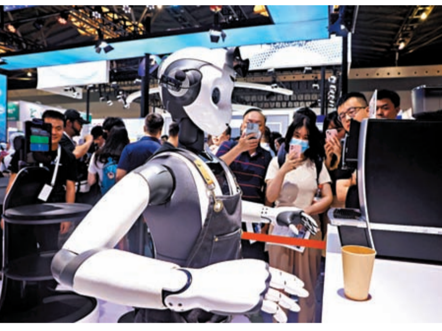
未來，浦東將探索面向全球的前沿技術攻關機制，建設開放創新生態。圖為早前，2023世界人工智能大會（WAIC）在上海舉行，一款服務機器人吸引觀眾眼球。 資料圖片

建立由政府資助形成的科研成果確權評估、商業轉化、收益分享機制，並支持在中國（上海）自由貿易試驗區臨港新片區建設全球離岸創新基地，探索主動融入全球科技創新網絡的「離岸支點」機制。