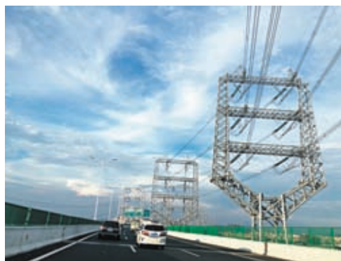
◆去年廣東工業中的製造業用電量佔比近五成，新能源產業成為亮點。圖為在廣東高速公路附近的電網。

去年廣東工業中的製造業用電量佔比近五成，新能源產業成為亮點。圖為在廣東高速公路附近的電網。