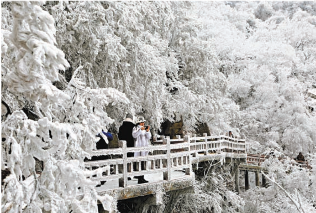
◆1月21日，江蘇省連雲港市海上雲台山風景區出現霧凇景觀，吸引眾多遊人前來觀賞。

香港文匯報訊（記者 江鑫嫻 北京報道）2024年首場寒潮強勢來襲。中國中央氣象台21日18時發布寒潮黃色預警、暴雪黃色預警、大風藍色預警，預計寒潮繼續影響中東部地區，帶來大風降溫天氣，南方多地將開啟「暴雪模式」。未來三天，寒潮還將繼續影響中東部地區，南方地區有大範圍雨雪天氣，局地有凍雨。23日最低氣溫0℃線將南壓到廣西北部及廣東北部一帶，南方多地氣溫將創入冬以來新低。為應對寒潮，多地民眾換上了厚冬裝，各地多措並舉保障民眾溫暖過冬。中國應急管理部亦於21日對湖南、貴州兩省啟動低溫雨雪冰凍災害IV級應急響應。