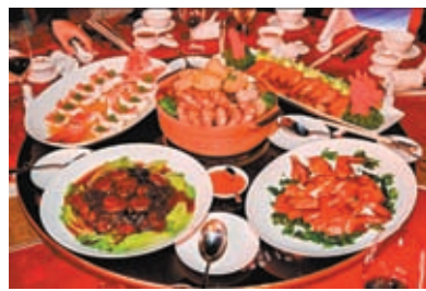
◆創先河，澳門銀河集團旗下8間餐廳，推出我國8個不同省市菜餚，結合特色盆菜賀龍年。

一再聽聞、眼見的例證：盆菜的食法，實爲方便山頭進食，筷子一雙立即拈括。發展下來，寶安圍村將盆菜不斷提升，食材豐富了，味道提煉了，進化成今天香港豐儉由人，於年節大放異彩的盆菜。