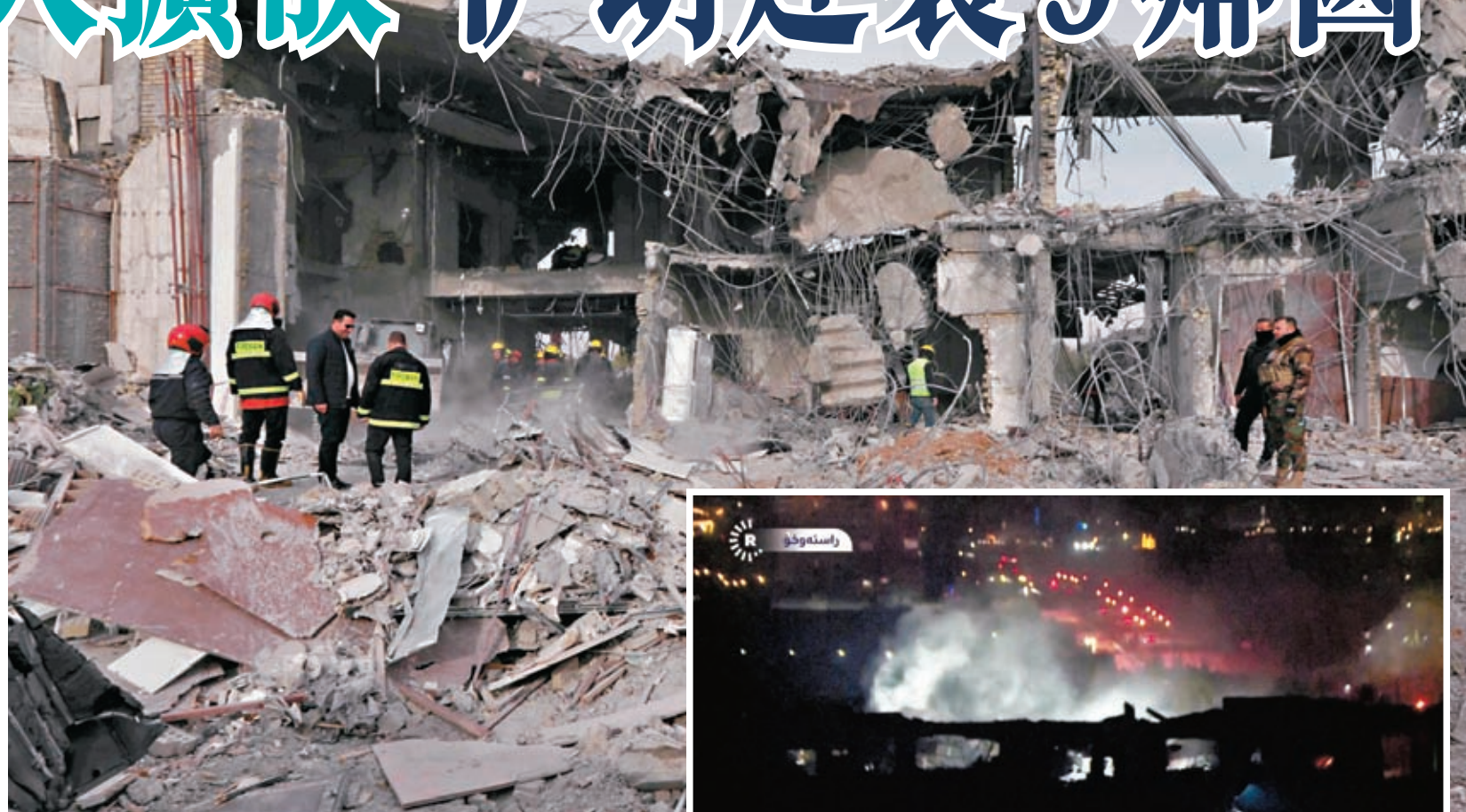
◆伊拉克庫爾德斯坦地區遭伊朗革命衛隊空襲後，民防隊員在廢墟中搜索。

伊朗周一晚曾發射導彈襲擊伊拉克庫爾德斯坦地區，聲稱打擊當地的以色列情報機關基地，同日並空襲敘利亞，宣稱旨在摧毀極端組織「伊斯蘭國」目標。伊拉克指襲擊造成4死6傷，宣布召回駐伊朗大使；伊朗則去信聯合國，稱空襲是有針對性的反恐行動。阿卜杜拉希揚強調，伊朗尊重伊拉克領土完整，這次襲擊只是針對在伊拉克運作的以色列情報組織摩薩德。他又表示伊朗向巴基斯坦發射的導彈和無人機，只是針對與以色列有關的恐怖分子。