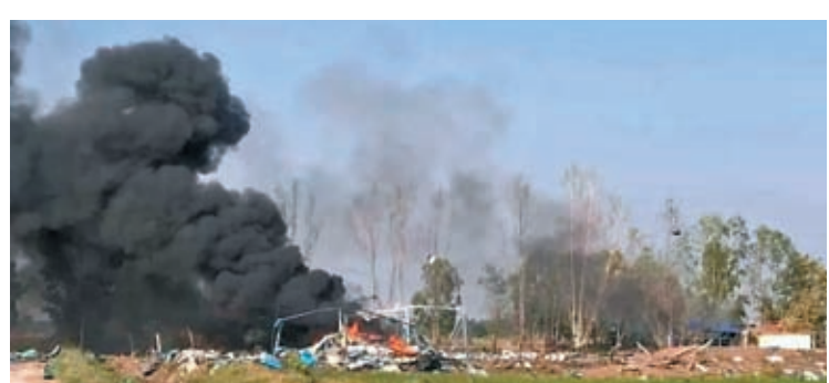
◆煙花廠爆炸現場冒出黑煙。

沃斯世紀經濟論壇，總理府表示塞塔已知悉事件，指示官員加緊調查事故原因和涉事工廠經營狀況。賽塔向事故中的死者表示哀悼，以及向死者家屬表示慰問。