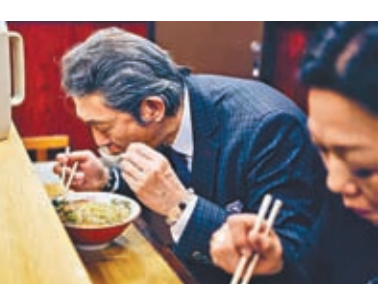
◆物價高漲下，不少日本打工仔均節省午餐費用。

日本去年合共多達逾3萬種食物漲價，民眾面對嚴峻的生活成本危機。由於進口牛肉價格飆升，大型連鎖食肆吉野家也決定7年來首次上調牛丼價格，但售價也只是468日圓。