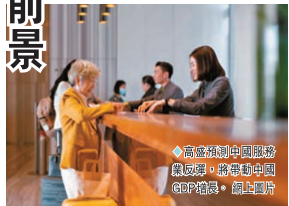
高盛預測中國服務業反彈，將帶動中國GDP增長。

日本瑞穗證券研究諮詢公司資深中國經濟學家塞雷娜·周表示，預計中國財政支持的政策空間會更大。美國投資銀行Jefferies的分析師則在給客戶的報告中寫道，「（中國）政府對經濟的支持，包括對房地產行業的支持，正在提振市場情緒，並推動上調對GDP增長的預期。」