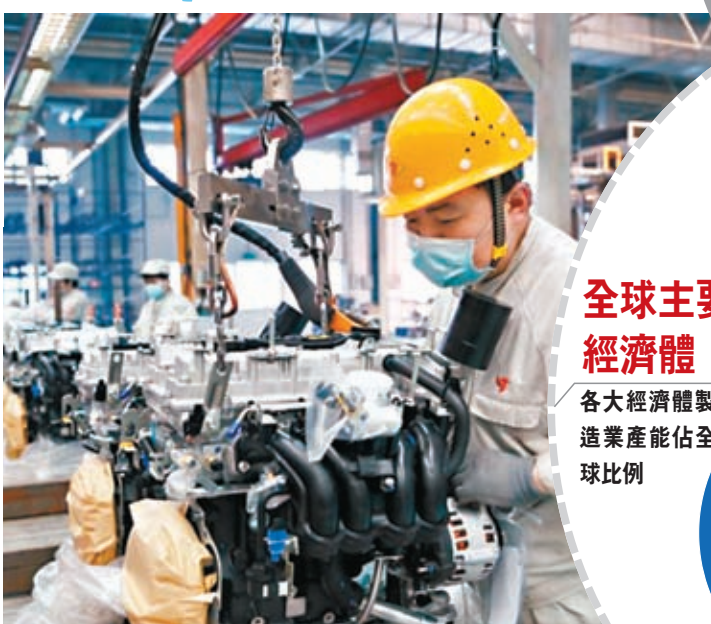
一名工人在哈爾濱一家汽車發動機工廠工作。網上圖片

香港文匯報訊 中國製造業多年來持續發展，在全球地位舉足輕重。總部位於倫敦的智庫「經濟政策研究中心」（CEPR）周三（1月17日）發布最新報告指出，中國的製造業產量位居全球首位，且產量超過其他居前10名的國家和地區總和。該文章作者、瑞士洛桑國際管理發展學院國際經濟學教授鮑德溫稱，中國製造業崛起深刻影響全球供應鏈變化，指出「現時中國是全球唯一一個製造業超級大國」。