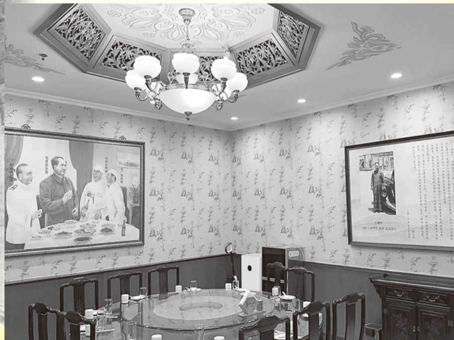
西安食堂毛主席用餐的房間。