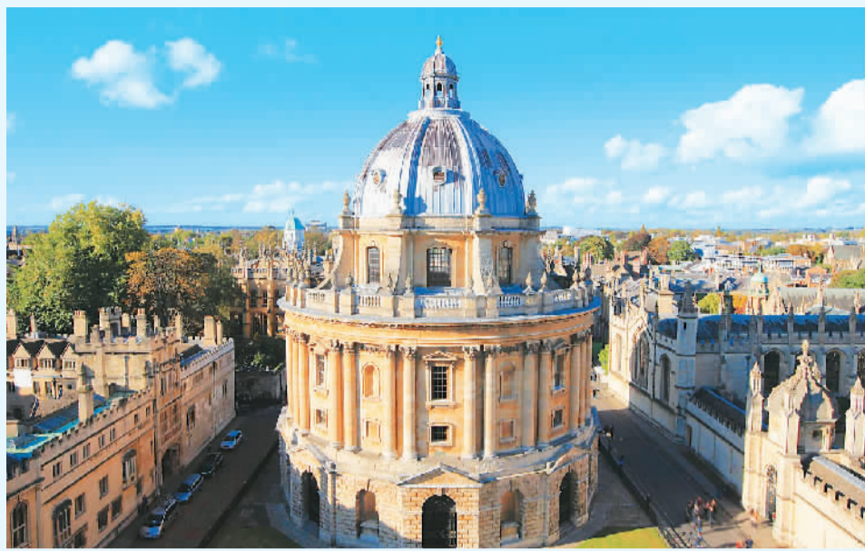
英国牛津大学校园景色。

留学选专业，是许多中国学生面临的重要决策之一。选择专业时如何考量？就此，记者通过对话不同国家的中国留学生、专业人士等，为大家提供一些参考。