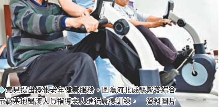
意見提出優化老年健康服務。圖為河北威縣醫養綜合示範基地醫護人員指導老人進行康復訓練。資料圖片

相關文件的發布令來自香港的大灣區醫療集團聯席行政總裁李家聰博士倍感振奮。過去幾年，他帶領團隊將港式醫療服務模式拓至大灣區內地城市，設立了包括港澳居民健康服務中心在內的160多間港式家庭醫生工作室。兩個