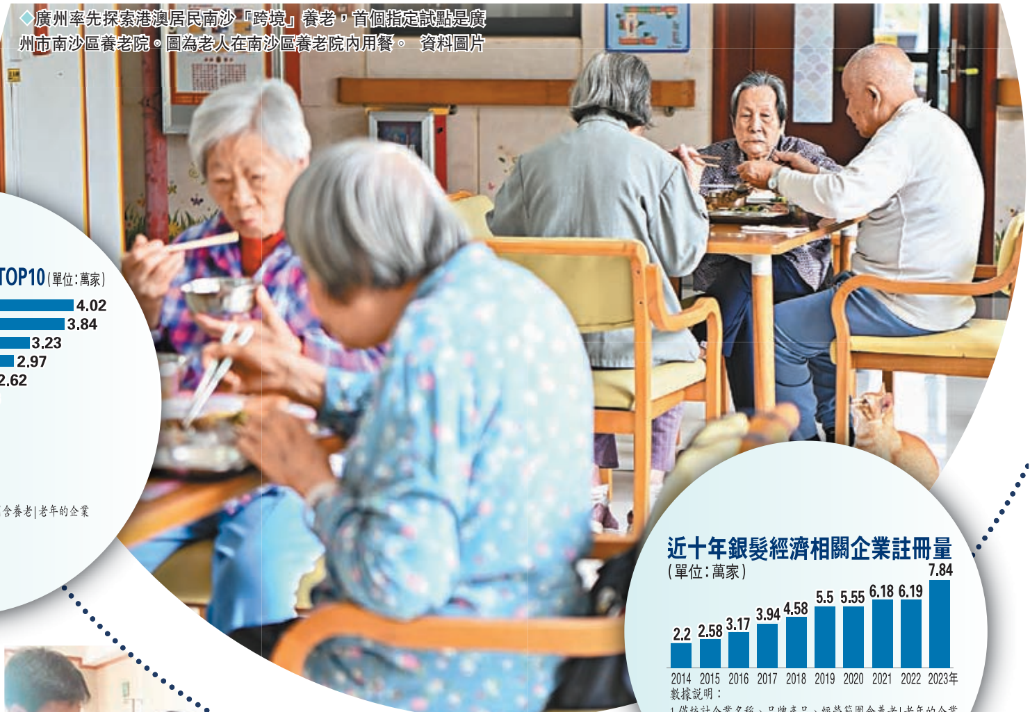
廣州率先探索港澳居民南沙「跨境」養老，首個指定試點是廣州市南沙區養老院。圖為老人在南沙區養老院內用餐。資料圖片