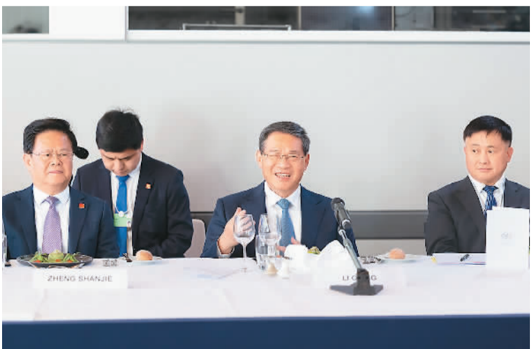
当地时间1月16日，国务院总理李强在瑞士达沃斯出席世界经济论坛创始人兼执行主席施瓦布主持的午餐会，同跨国公司负责人进行交流。

沃尔玛、摩根大通、英特尔、巴斯夫、大众、西门子等14家跨国公司负责人参加午餐会。他们表示，多年来投资中国市场取得巨大成功，对中国经济发展充满信心，愿继续深化对华合作，坚持在中国发展，为中国发展作出贡献。