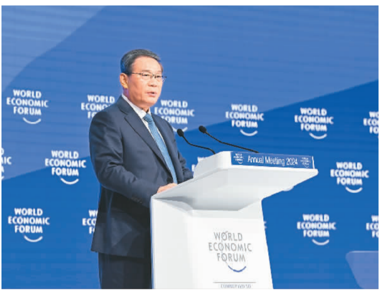
当地时间1月16日上午，国务院总理李强在瑞士达沃斯国际会议中心出席世界经济论坛2024年年会并发表特别致辞。