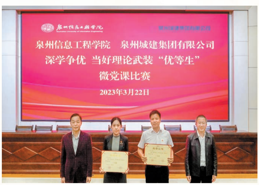
「黨建+鄉村振興」品牌參加泉州城建集團+泉州信息工程學院首場校企合作微黨課比賽榮獲一等獎。