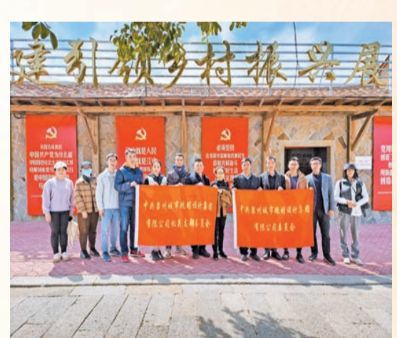
「黨建+鄉村振興」核心技術團隊走進泉港惠嶼村。

黨建興則企業興，黨建強則企業強。泉州城建集團權屬企業泉州城市規劃設計集團（以下簡稱「規劃設計集團」）自整合成立以來，堅持以黨建為引領，將黨建融入主營業務、人才培育和生產安全各環節，2023年以來凝心聚力打造三個「黨建+」特色品牌，接連在各級黨建品牌競賽中取得3項一等獎、1項二等獎佳績，深深築牢國有企業的「根」和「魂」，為推動企業高質量發展提供堅強保證。