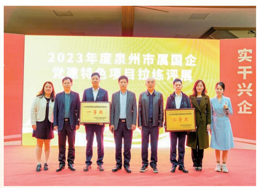
「黨建+鄉村振興」「黨建+人才競崗」兩個特色黨建項目，在泉州市屬國企黨建特色項目拉練評展中分別榮獲一、二等獎。