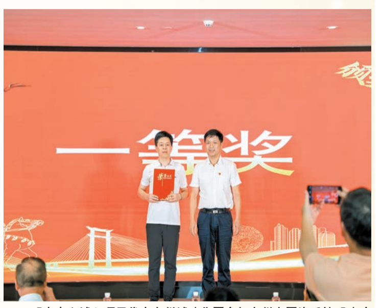
「未來之城」項目代表泉州城建集團參加泉州市國資系統「建功新國企」微宣講競賽榮獲一等獎。

監督是工程質量安全的一個重要保證因素，規劃設計集團權屬企業監理事務所公司，是一家深耕監理服務行業30年的老牌國有監理企業，已承接項目超5500個，監理質量深受業界好評。2023年規劃設計集團黨委根據監理事務所公司企業特點，為其量身打造「黨建+質量安全」品牌。通過每個月召開一次安全生產研創會、每季度組織一次對一線項目地檢式全覆蓋質量安全巡查、常態化開展安全隱患排查治理工作、舉辦「安全生產月」主題知識競賽活動等多措並舉方式，將