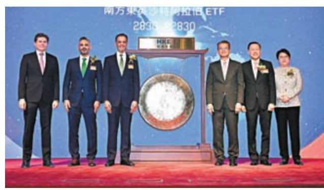
◆亞洲首隻沙特阿拉伯ETF去年11月底在港掛牌。

根據商經局資料，香港至今已與20個經濟體簽訂8份自由貿易協定(自貿協定)，有關經濟體為中國內地、澳門特區、新西蘭、歐洲自由貿易聯盟(即冰島、列支敦士登、挪威和瑞士)、智利、東南亞國家聯盟十國、格魯吉亞及澳洲。丘應樺表示，目前正在和秘魯就自由貿易協定進行談判，同時也在和其他國家就投資保護協定進行洽談，比如巴林、孟加拉和沙特阿拉伯等。對於香港加入《區域全面經濟夥伴協定(RCEP)》的時間表，丘應樺表示仍需要經過各國內部的核准程序，按照條款，他們有18個月的時間審議，香港正在努力爭取盡快通過會員加入程序。