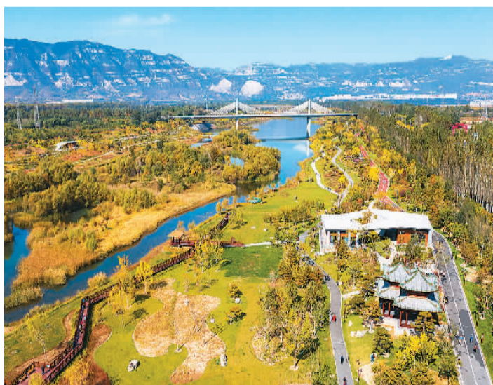
山西省太原市汾河畔的雁丘园风光。

“问世间，情是何物，直教生死相许？”悲壮殉情，至死不渝的大雁震动了词人的内心，将震惊、悲恸、同情与感动化为这壮士抚剑