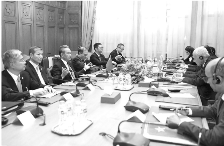
当地时间1月14日，中共中央政治局委员、外交部长王毅在开罗会见阿盟秘书长盖特。