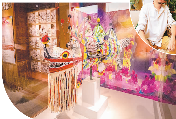
▲ 鸬鸟镇非物质文化遗产展示馆中的整鱼灯。