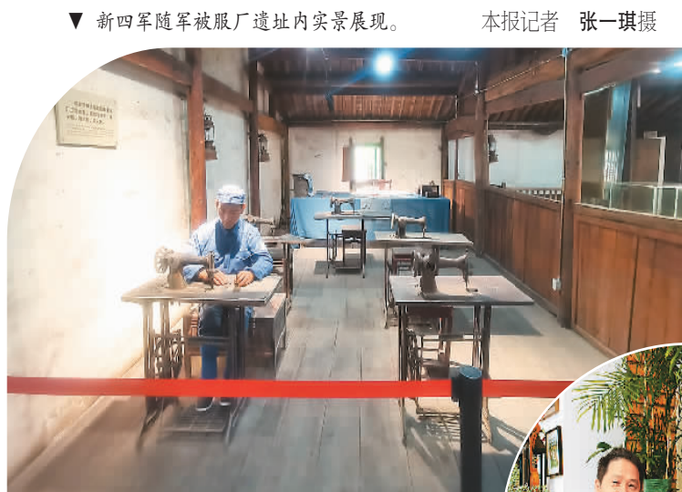
▼ 新四军随军被服厂遗址内实景展现。