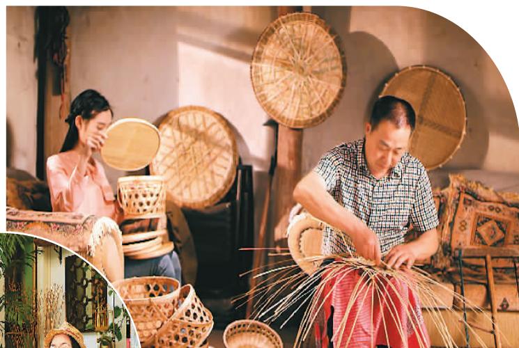
▼ 竹编手艺人正在编竹篮。