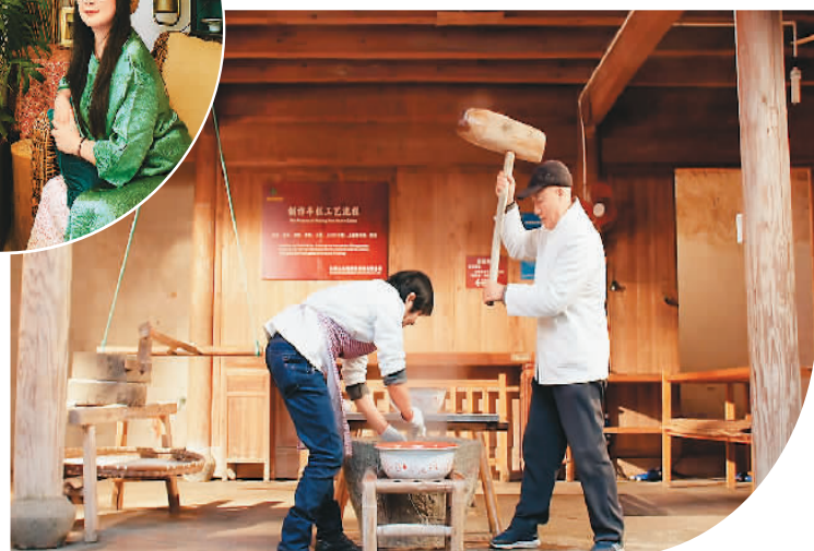
▲ 村民正在打年糕。