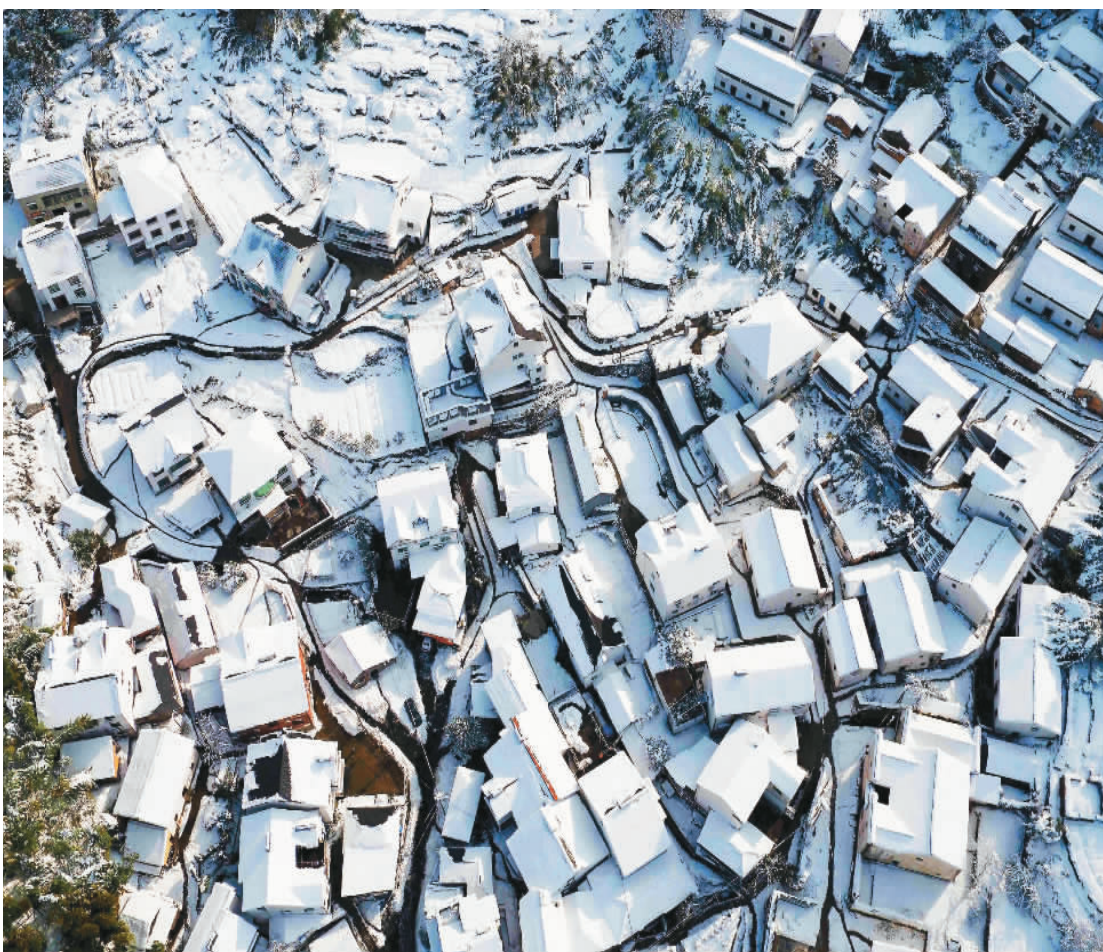
▼ 大雪覆盖山沟沟村。