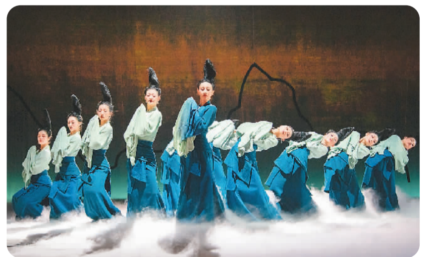
舞蹈诗剧《只此青绿——舞绘〈千里江山图〉》剧照。