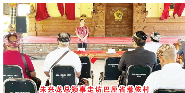
朱兴龙总领事走访巴厘省惹依村