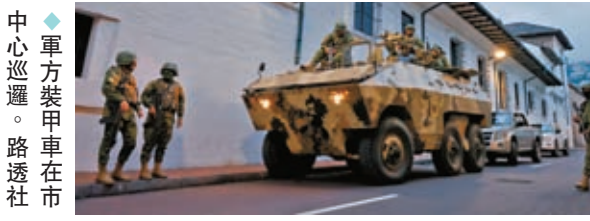
軍方裝甲車在市中心巡邏。