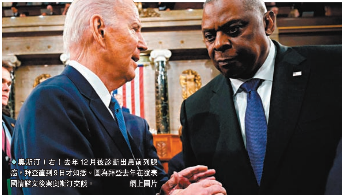
奧斯汀（右）去年12月被診斷出患前列腺癌，拜登直到9日才知悉。圖為拜登去年在發表國情諮文後與奧斯汀交談。

奧斯汀擔任美軍中央司令部司令期間的下屬，曾每天向他匯報全球情報的前美軍軍官瓦格納在媒體撰文，指奧斯汀的做法暴露出4個事關美軍領導力乃至國家安全的大問題，包括導致領導真空，無法讓盟友安心和震懾敵人，屬疏忽職守；隱瞞病情是傲慢和耍弄特權；其他國防部高官長時間對他的病情不知情，說明五角大樓整個指揮鏈出了問題；他的健康關係國家安全，但安保人員沒有及時通報，是無法讓人接受的不稱職。