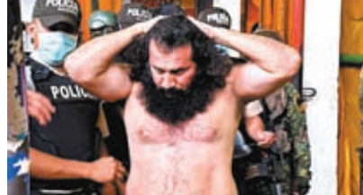
馬西亞斯2011年因販毒和謀殺等多項罪名被判處34年監禁。