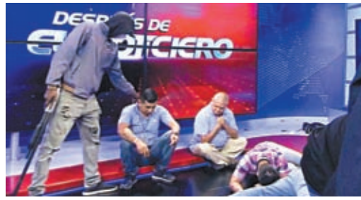
武裝分子闖電視台挾持工作人員。

《華盛頓郵報》稱，近年厄瓜多爾面臨嚴重暴力浪潮，隨着該國成為可卡因交易的關鍵中轉站，不同幫派爭奪販毒線路及監獄控制權。鄰國秘魯9日宣布該國與厄瓜多爾毗鄰的整個北部邊境地區進入緊急狀態。