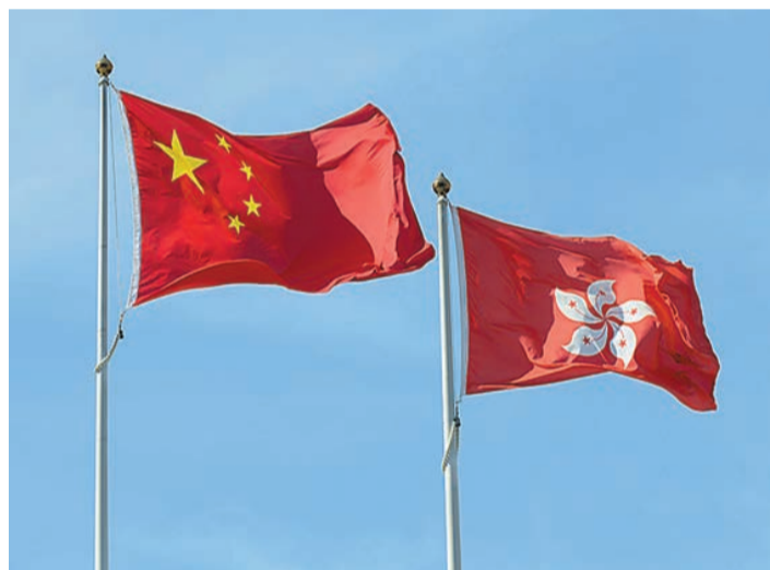
維護國家安全，香港社會各界責無旁貸。資料圖片

相反，《香港國安法》實施三年半以來，相信每一位市民都切實感受到香港社會由亂到治再由治及興。回想2019年的「黑暴」和港版「顏色革命」，嚴重危害社會安寧和特區管治權，小市民外出上班上學、搭車、購物等，連人身安全都受到極大威脅，惶恐終日。試想