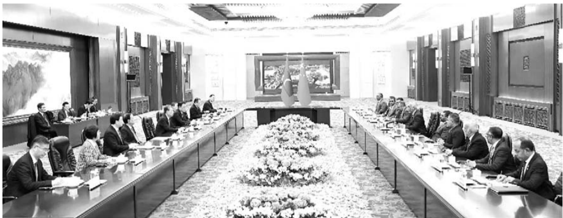
1月11日,全国人大常委会委员长赵乐际在北京人民大会堂会见马尔代夫总统穆伊兹。

新华社北京1月11日电 全国人大常委会委员长赵乐际11日在北京会见马尔代夫总统穆伊兹。