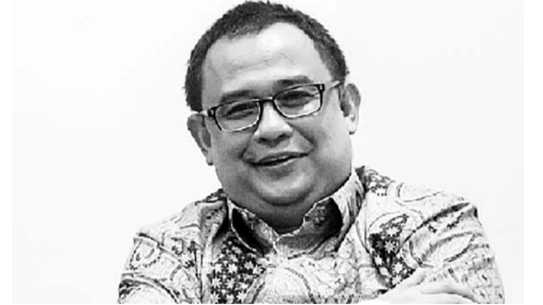
总统府特别专员统筹人阿里·德威巴雅纳 (Ari Dwipayana)。

【本报讯】总统府特别专员统筹人阿里·德威巴雅纳 (Ari Dwipayana) 回应了普拉波沃-吉布兰胜选志愿团队的说法,即佐科维总统支持普拉波沃-吉布兰正副总统候选人。