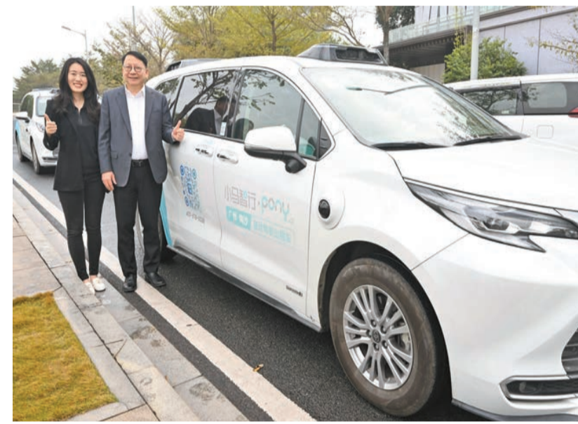
政務司司長陳國基(右)在小馬智行副總裁莫瑛怡(左)陪同下，在廣州南沙試乘該公司的自動駕駛出租車。

【香港商報訊】記者戴合聲報導：政務司司長陳國基昨日在廣州和惠州繼續粵港澳大灣區內地城市訪問行程。他表示，期待港穗兩地繼續貫徹「優勢互補、互利共贏」的原則，在經貿、文化等領域拓展交流合作並推動更多政策創新和突破，為大灣區高質量建設作出新貢獻。