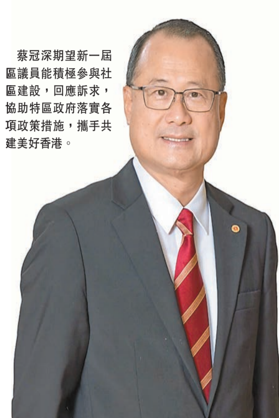
蔡冠深期望新一屆區議員能積極參與社區建設，回應訴求，協助特區政府落實各項政策措施，攜手共建美好香港。

高端訪問 由本報聯合各大商會、社團舉辦的「2023香港商界最關注的10件大事」評選活動每年均吸引眾多港人參與。在香港中華總商會會長蔡冠深眼中，2023年是充滿挑戰的一年，「香港逐漸通關復常」無疑令人關注，而「共建『一帶一路』倡議十周年」、「李家超發表第二份施政報告」、「第七屆區議會選舉成功舉行」等均為大事，「香港擁有『背靠祖國、聯通世界』的獨特優勢，期待特區政府落實各項政策措施，與各界攜手共建美好香港，寫好良政善治新篇章。」 香港商報記者 雷虹