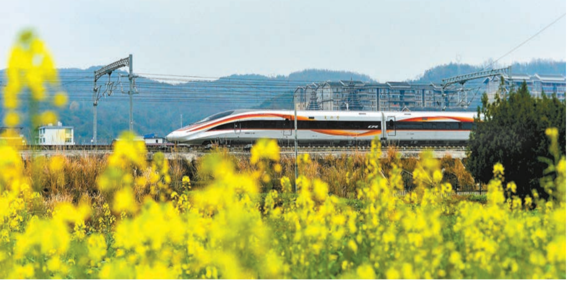
1月10日零時起，全國鐵路實行新列車運行圖，圖為一列動車組列車在貴州省從江縣境內行駛。

【香港商報訊】綜合消息，1月9日，中國國家鐵路集團有限公司工作會議在北京召開。會議指出，國鐵集團圓滿完成了去年全年各項目標任務，推動鐵路高質量發展取得顯著成效。截至2023年底，中國鐵路營業里程達到15.9萬公里，其中高鐵達到4.5萬公里。