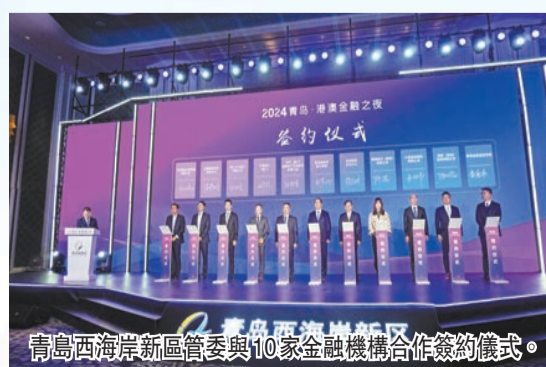
青島西海岸新區管委與10家金融機構合作簽約儀式。

助力境內企業「走出去」發展，推動境外資源「引進來」，打造青島與港澳金融合作平台。 與此同時，青島西海岸新區管委選與國家開發銀行以及五大國有商業銀行青島市分行合作簽約，聚焦服務實體經濟暢通融資渠道，推動銀行圍繞重大項目、重點領域、科技創新、民生發展、民營小微、支持國有企業發展等方面全力擴大信貸投放，打造區域金融戰略同盟。此外，青島經濟技術開發區投資控股集團有限公司與3家港澳金融機構合作簽約，拓寬國有企業融資發展新路徑。 據悉，青島西海岸新區與港澳產業互補性強，合作領域不斷拓展，港澳已經成為新區重要的對外貿易合作夥伴和重要外資來源地。西海岸新區高標準規劃建設唐島灣金融創區，深入推動各類金融業