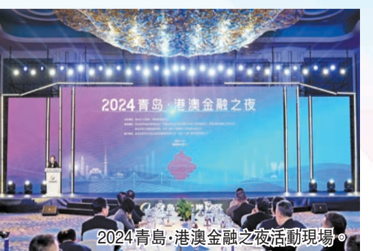
2024青島·港澳金融之夜活動現場。

態服務實體經濟，截至目前，西海岸新區集聚各類金融機構累計242家，其中納入監管的各類地方金融組織86家，資產規模571.39億元人民幣。未來，