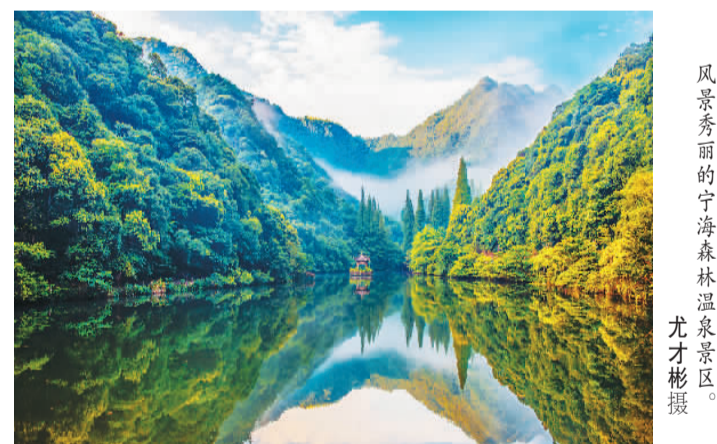
风景秀丽的宁海森林温泉景区。

寒潮来袭，位于浙江省宁波市宁海县深甽镇的宁海森林温泉景区却是一派“火热”景象，掩映于山林间的十余个露天温泉池冒着热气，男女老少沉浸于温暖的泉水中，尽享天然温泉和自然美景带来的闲适。