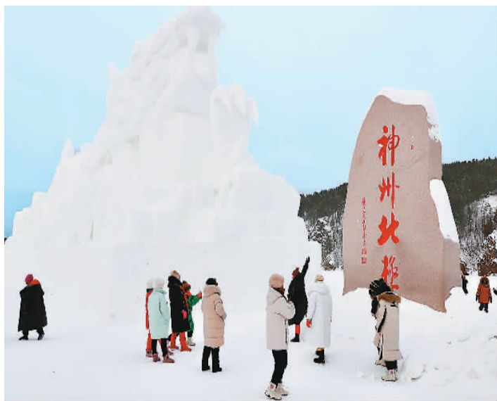
游客在黑龙省漠河市北极村拍照。