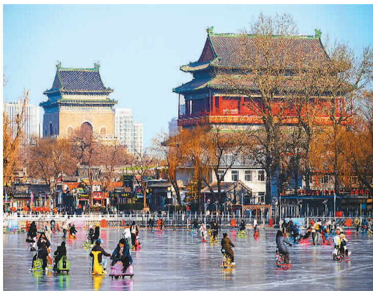
市民和游客在北京什刹海冰场滑冰。