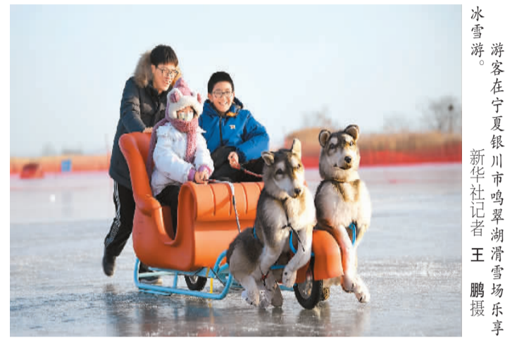
游客在宁夏银川市鸣翠湖滑雪场乐享冰雪游。

六盘山深处的宁夏固原市泾源县是座人口不足9万的小城，却拥有两座滑雪场，一到雪季不少“宁”“陕”