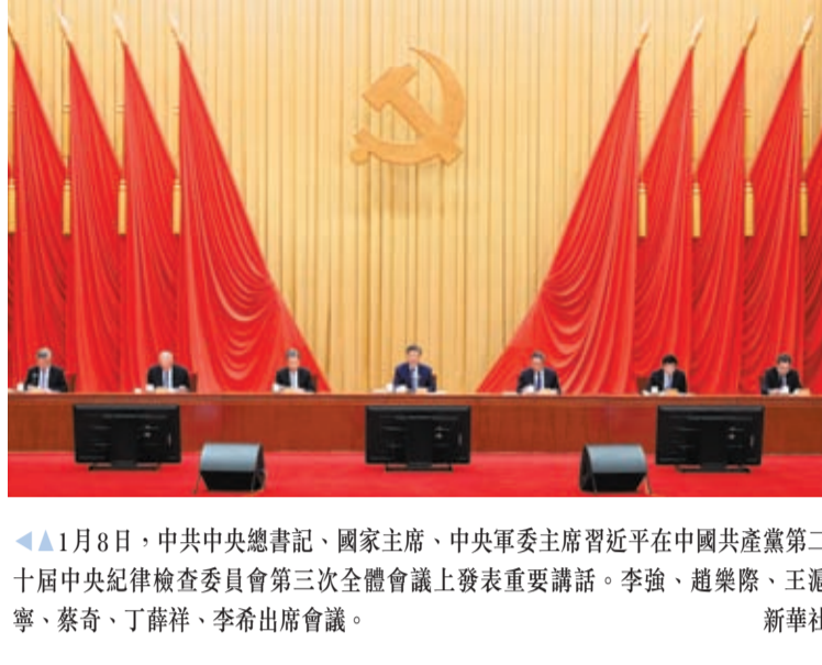
1月8日，中共中央總書記、國家主席、中央軍委主席習近平在中國共產黨第二十屆中央紀律檢查委員會第三次全體會議上發表重要講話。