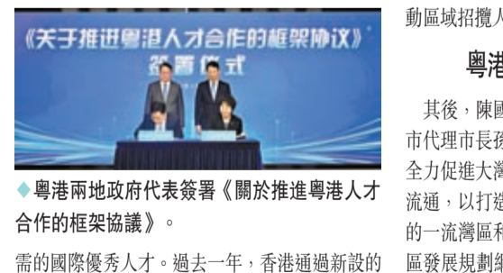
粵港兩地政府代表簽署《關於推進粵港人才合作的框架協議》。

香港文匯報訊 香港特區政府政務司司長陳國基8日抵達廣州，展開粵港澳大灣區內地城市訪問行程。