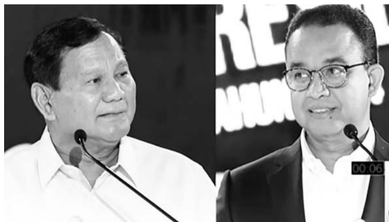
左起：普拉波沃和阿尼斯。

【本报讯】1月8日，一号总统候选人阿尼斯坦言，感觉非常惊讶听到佐科维总统评论于1月7日举行的总统候选人辩论会。阿尼斯自承，并不想对佐科维的观点发表更多评论，并将评估留给公众，让公众让看看印度尼西亚头号人物的行为。 阿尼斯否认了佐科维的观点，即当晚的辩论会被称为对其他总统候选人的大量人身攻击。阿尼斯表示，我们讨论的问题是国防部长执行的政策，而不是攻击普拉波沃。把它看作是个人的问题是非常奇怪的，这与个人问题无关，一切都与政策有