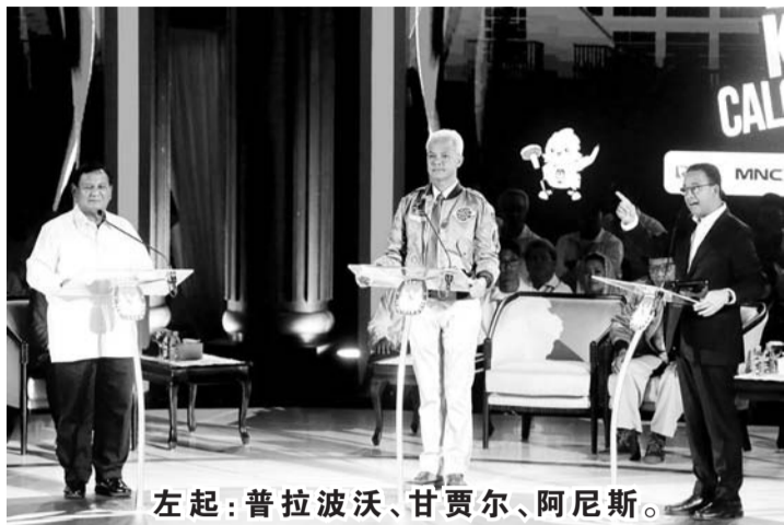
左起：普拉波沃、甘贾尔、阿尼斯。

【本报讯】连续体研究所发表1月7日晚上的第三场辩论，在社交媒体上发布的对三位总统候选人的公众看法。一号总统候选人阿尼斯被认为是一个聪明的人物，二号总统候选人普拉波沃被认为是坚定的，而三号总统候选人甘贾尔被认为是一个聪明的答辩者。 INDEF Continuum 数据分析师梅茜 (Maisie Sagita) 在 Continuum 于1月8日在线举行的题为《揭开总统候选人关于地缘政治和国防的想法》公开讨论中，提供了分析文章。梅茜解释说，阿尼斯受到45.7%公众的关注为最多，普拉波沃被36.8%的公众关注，甘贾尔被17.6%的公众关注。虽然是最受关注的，但事实证为阿尼斯在其两个竞争对手中获得了最低的积极情绪81.7%为最高，其次是普拉波沃为61.6%和阿尼斯为47.9%。 此外，梅茜还探讨了这些总统候选人中的每一个都成为公众关注焦点的事情。对阿尼斯正面讨论的