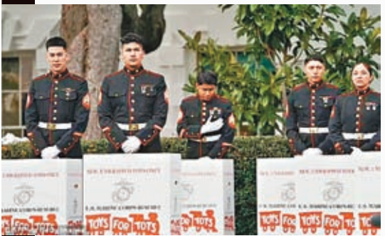
▲ 美國海軍陸戰隊隊員在白宮南廊出席儀式。