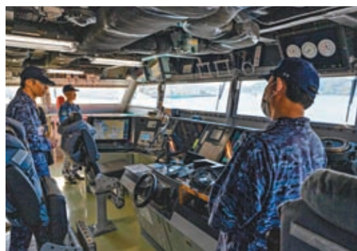
▲ 日護衛艦「能代號」減少船員數目。 網上圖片

韓國也面對同樣難題，祥明大學國家安全學教授崔秉玉表示，作為全球出生率最低的國家，韓國在應對日益緊張的西太平洋地區新威脅時，可能很快會發現沒有足夠軍隊，「人口問題可能是韓國現時最大的敵人，以我們目前的出生率，縮減軍隊規模將無可避免。」