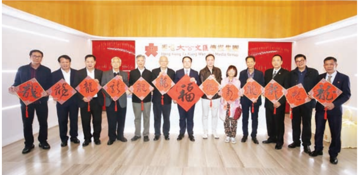
粤港澳书画家创作“龙”书法