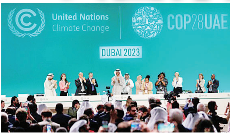
2023年12月13日,在联合国气候变化迪拜大会闭幕全体会议上,COP28主席苏丹·贾比尔宣布达成“阿联酋共识”后,参会人员起立鼓掌。