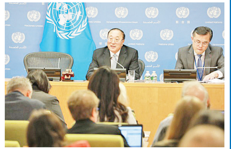
2023年11月1日,在位于纽约的联合国总部,中国常驻联合国代表张军(左)在媒体吹风会上讲话。

出,中国在气候行动方面慎重承诺并超额兑现,其他国家应向中国学习。 应对气候变化等全球性风险挑战,需要有效的全球治理体系。其中,维护大国关系稳定尤为关键。2023年,中国努力推动构建和平共处、总体稳定、均衡发展的重大关系格局,为维护全球战略稳定贡献正能量。 从稳妥应对中美关系面临的困难挑战,到年中接待美国国务卿布林肯、财政部长耶伦、商务部长雷蒙多等高官访华,再到习近平主席11月赴美与美国总统拜登会晤并就管控分歧和开展相关合作取得多项成果,中国面对美国持续挑动“大国竞争”,在坚决维护自身权益的