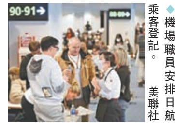
◆機場職員安排日航乘客登記。

日航3日宣布，遊客於2日前預訂、今年3月31日之前出發的日航機票，均可免手續費改機票或退款，申請可於本月31日之前提出。