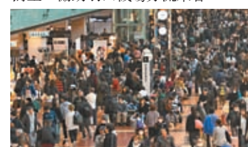
◆羽田機場有大批乘客排隊，安排更改機票事宜。

計劃從東京回到家鄉福岡，「我不知道飛機還能否起飛，感到有些害怕。」德島縣一名70多歲女遊客也稱，「我原計劃2日從羽田飛往夏威夷，但發生意外後，我的航班取消了。我要改變出行計劃，回到德島家中。」涉事日航客機從北海道飛抵羽田機場，事發後北海道新千歲機場往返羽田機場的航班全部取消，約200名乘客只能在新千歲機場過夜。JR東日本3日加開4班新幹線臨時列車，以東京站開往新大阪站為主，協助羽田機場分流乘客。