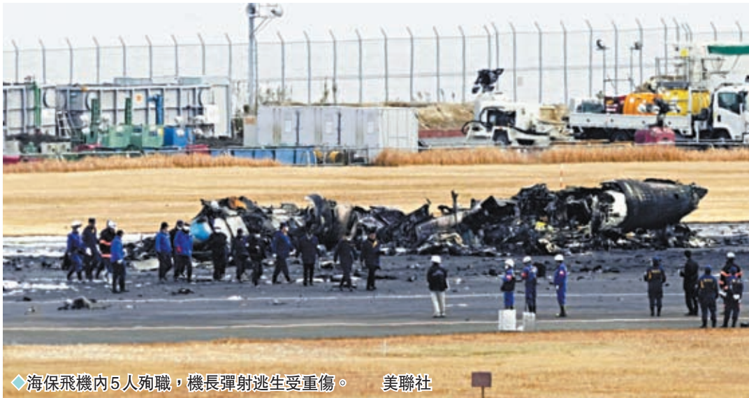
◆海保飛機內5人殉職，機長彈射逃生受重傷。

針對今次事故，日本運輸安全委員3日已展開調查，警視廳也將循涉嫌職業疏忽致人傷亡嫌疑，設立搜查總部調查事件。涉事日航客機的組裝工作在法國完成，引擎於英國製造，空中巴士公司及法國和英國都會派出專家，到日本協助調查事件。