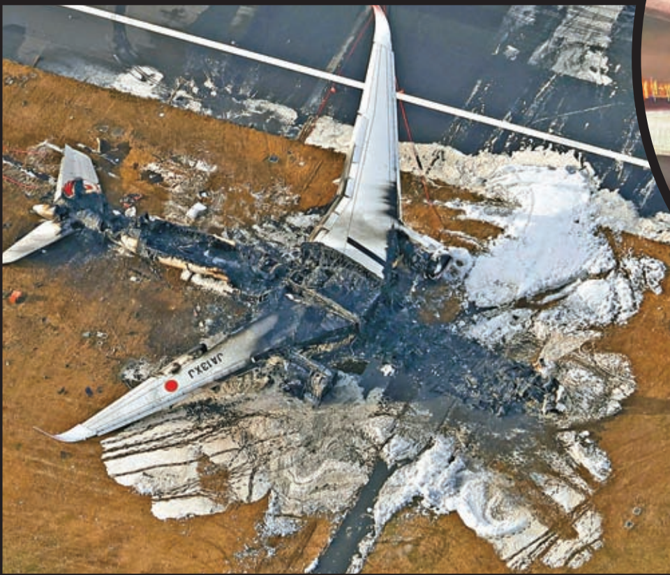
◆日航客機被撞成廢鐵。

香港文匯報訊 日本東京羽田機場1月2日發生的飛機相撞事故中，日本航空客機從下午5時47分降落，到6時05分確認完成疏散，機上合共379人全部生還，創造了「奇跡18分鐘」。全球多地航空分析師指出，事發客機機組成員訓練有素，乘客聽從指示疏散、沒有攜帶隨身行李，都是逃生關鍵。飛機採用的碳纖維材料阻燃性能較好，令火勢未有迅速蔓延，也為機上人員提供了寶貴的逃生時間。