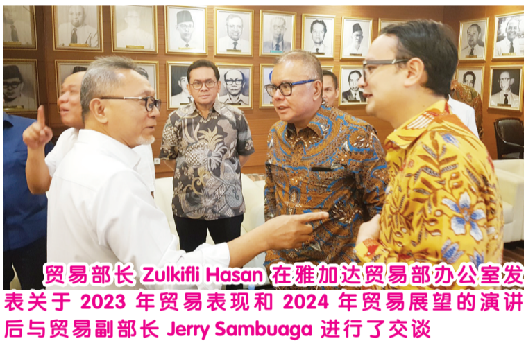
贸易部长 Zulkifli Hasan 在雅加达贸易部办公室发表关于2023年贸易表现和2024年贸易展望的演讲后与贸易副部长 Jerry Sambuaga 进行了交谈