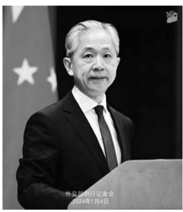
外交部发言人汪文斌。

截至2023年12月31日,各督察组共收到民众来信、来信举报19815件,受理有效举报16700件,经梳理合并重复举报,累