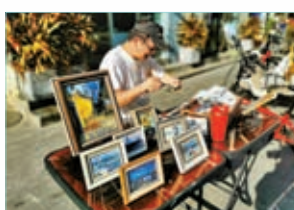
◆大芬油畫村有不少畫家都跟上時代步伐走出畫室。