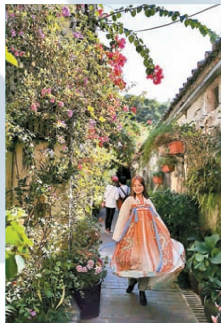
◆網紅租華服在龍崗甘坑古鎮穿越古代。

日前，2023「潮嘆龍崗」深港台潮創樂享周，在深圳市龍崗區舉行了文旅龍崗專線打卡活動，以及港風潮流音樂會專場。來自深圳和香港的藝術家及網絡達人齊聚一堂，透過交流加深各地文化聯結。甘坑古鎮、大芬油畫村、龍城CC文創街區等地，皆以新穎形式展現傳統古樸風範與中華精神。「潮嘆龍崗」深港台潮創樂享周包括有網紅文化交流團考察活動、集市及在萬達廣場舉行的音樂會。深圳市龍崗區台港澳事務局局長劉德平表示，龍崗區是深圳市第二大區，國際級的科技公司落戶龍崗，還有三所高等院校均位於龍城街道深圳國際大學園，體育館深圳大運中心，甘坑古鎮、玫瑰海岸、西涌等旅遊資源，這都鼓勵了各地年輕人到龍崗遊覽、探索、發展。 文：雨竹