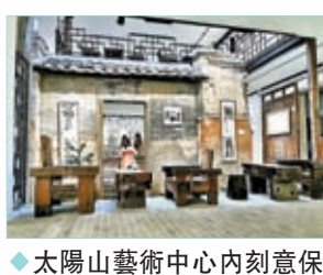
◆太陽山藝術中心內刻意保留的建築遺址。