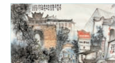
◆香港著名畫家陳偉老師筆下的深圳龍崗甘坑古鎮。