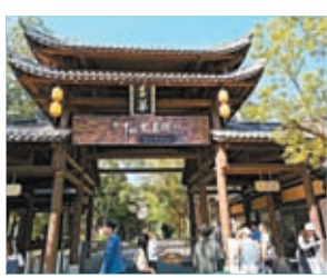
◆甘坑古鎮的二十四史書院