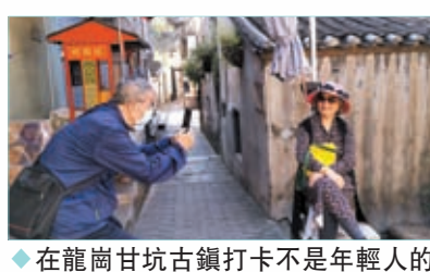
◆在龍崗甘坑古鎮打卡不是年輕人的專利。