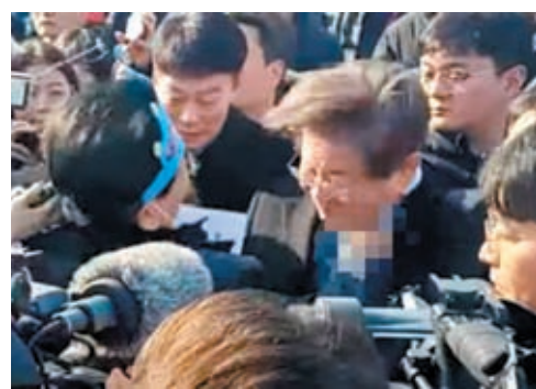
李在明被刺一刻。

警方調查顯示，約60歲的金某於去年從網絡上購買今次行兇用的刀具，長約18厘米，他沒有犯罪紀錄。