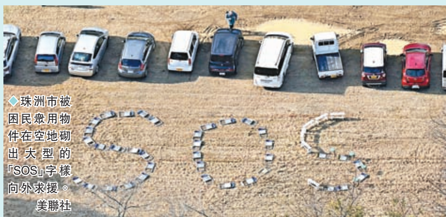
珠洲市被困民眾用物件在空地砌出大型的「SOS」字樣向外求援。

跟進事態發展。目前有數十個港人旅行團在日本。專辦日本旅行團的東瀛遊宣布，為確保旅客安全，會取消1月份所有前往石川縣輪島市共10個團的行程，約150人受影響，他們可選擇轉團、保留團費及全數退款，旅行社不會收取手續費。香港機場仍有不少港人準備啟程前往日本旅遊，有人指不擔心，會繼續行程。