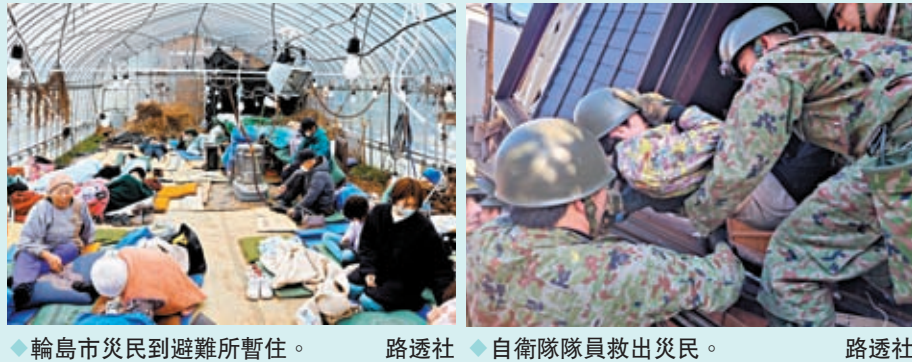
輪島市災民到避難所暫住。 路透社 自衛隊隊員救出災民。 路透社