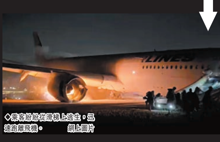
乘客紛紛從滑梯上逃生，迅速跑離飛機。