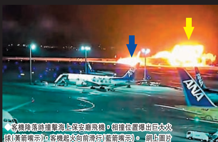
客機降落時撞擊海上保安廳飛機，相撞位置爆出巨大火球(黃箭指示)，客機起火向前滑行(藍箭指示)。

日本國土交通省東京機場事務所表示，羽田機場當日多數航班取消。由於羽田機場發生事故，原定抵達該機場的至少18個航班，改在東京成田機場降落。