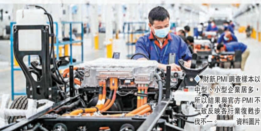
◆財新PMI調查樣本以中型、小型企業居多，所以結果與官方PMI不一致反映各行業復甦步伐不一。 資料圖片