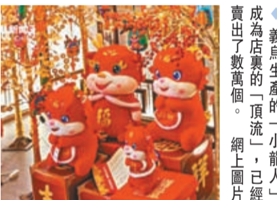
◆義烏生產的「小龍人」成為店裏的「頂流」，已經賣出了數萬個。

在全球經濟增速放緩的大背景下，浙江市場積極擁抱變化，走出了一條「進擊之路」。2023年前三季度，浙江2,960家商品市場成交額達1.65萬億元，均成交額5.58億元，同比分別增長8.49%、4.35%。有商品市場搭乘數字化快車，擁抱「Z世代」。坐落於浙江諸暨山下湖鎮的華東國際珠寶城，是中國最大的珍珠交易市場，去年通過「產業+市場+直播」的發展模式，上演「瘋狂的珍珠」。隨着國潮風的興起，相信新的一年更有盼頭。