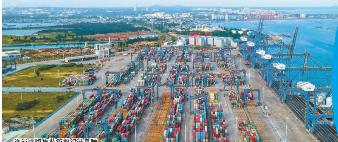
洋浦國際集裝箱樞紐港島瞰。

流營商環境目標，落實全球貿易商計劃和優化營商環境三年行動計劃，事項審批更加便捷高效，資源要素獲取更加公平公開；加快優化數字營商環境建設，高效推進社會信用體系建設，市場主體滿意度和投資吸引力不斷增強。2023年，洋浦片區+環灣七鎮500萬以上投資項目達225個，計劃投資384.8億元，發展前景無比廣闊。