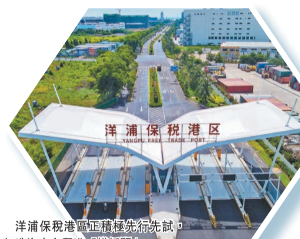
洋浦保稅港區正積極先行先試，打造海南自貿港「樣板間」。

中國全面深化改革開放的「時」與「勢」把建設中國特色自貿港的歷史使命交給了海南。2022年以來，海南省委、省政府全力推進儋（州）洋（浦）一體化，加快建設海南自由貿易港「樣板間」，打造海南自貿港高質量發展「第三極」，受到海內外高度關注。 環新英灣地區是儋洋一體化高質量發展的核心區，面向世界、面向未來的自貿港新城，是海南自貿港最有活力、最具發展潛力的地區之一。《海南自由貿易港建設總體方案》發布三年多來，環新英灣地區複合GDP年均增長約13%，儋州洋浦2022年區域GDP總量位居海南全省第二。2023年，洋浦片區+環灣七鎮500萬元（人民幣，下同）以上項目達225個，計劃投資384.8億元，發展前景無比廣闊。 文：謝賢仁 杜敬現 圖：中共儋州市委宣傳部