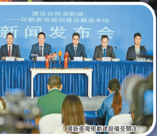
環新英灣規劃建設備受關注。

中國全面深化改革開放的「時」與「勢」把建設中國特色自貿港的歷史使命交給了海南。2022年以來，海南省委、省政府全力推進儋（州）洋（浦）一體化，加快建設海南自由貿易港「樣板間」，打造海南自貿港高質量發展「第三極」，受到海內外高度關注。 環新英灣地區是儋洋一體化高質量發展的核心區，面向世界、面向未來的自貿港新城，是海南自貿港最有活力、最具發展潛力的地區之一。《海南自由貿易港建設總體方案》發布三年多來，環新英灣地區複合GDP年均增長約13%，儋州洋浦2022年區域GDP總量位居海南全省第二。2023年，洋浦片區+環灣七鎮500萬元（人民幣，下同）以上項目達225個，計劃投資384.8億元，發展前景無比廣闊。 文：謝賢仁 杜敬現