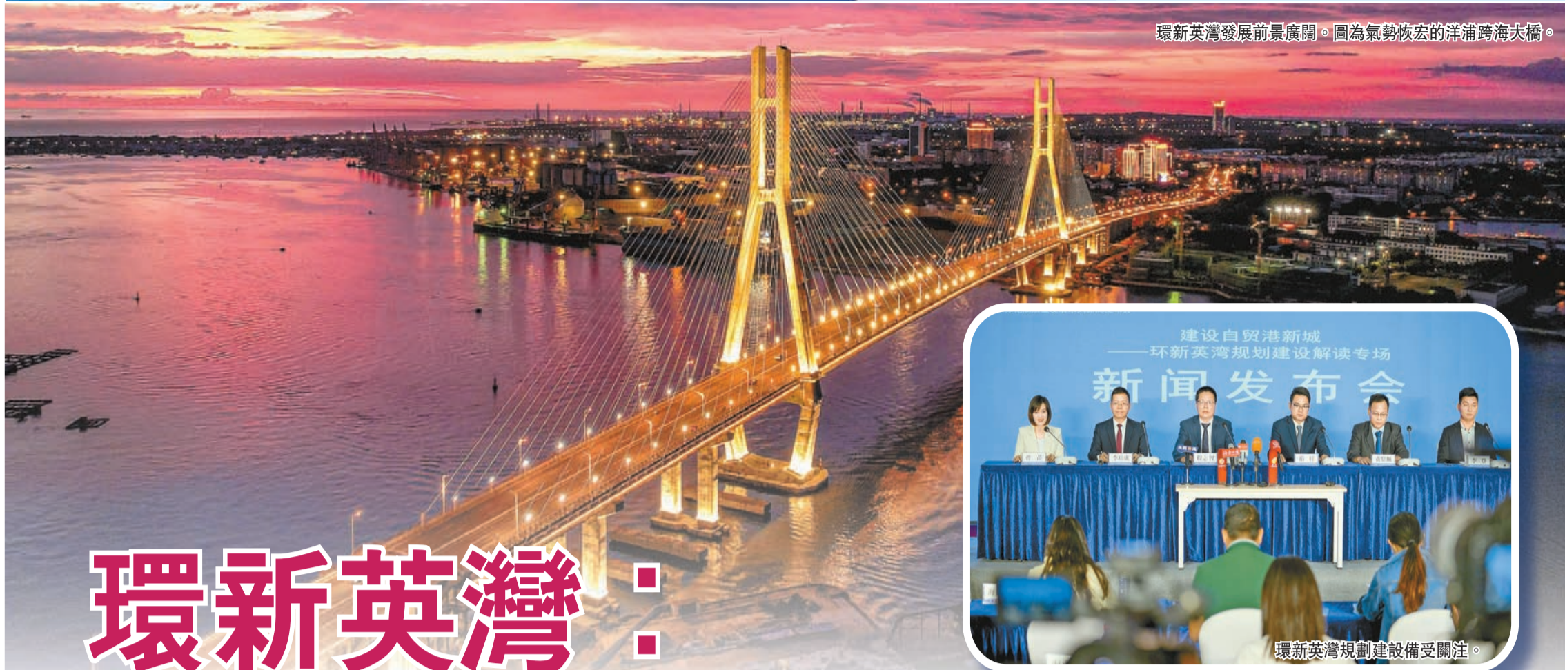
環新英灣發展前景廣闊。圖為氣勢恢宏的洋浦跨海大橋。