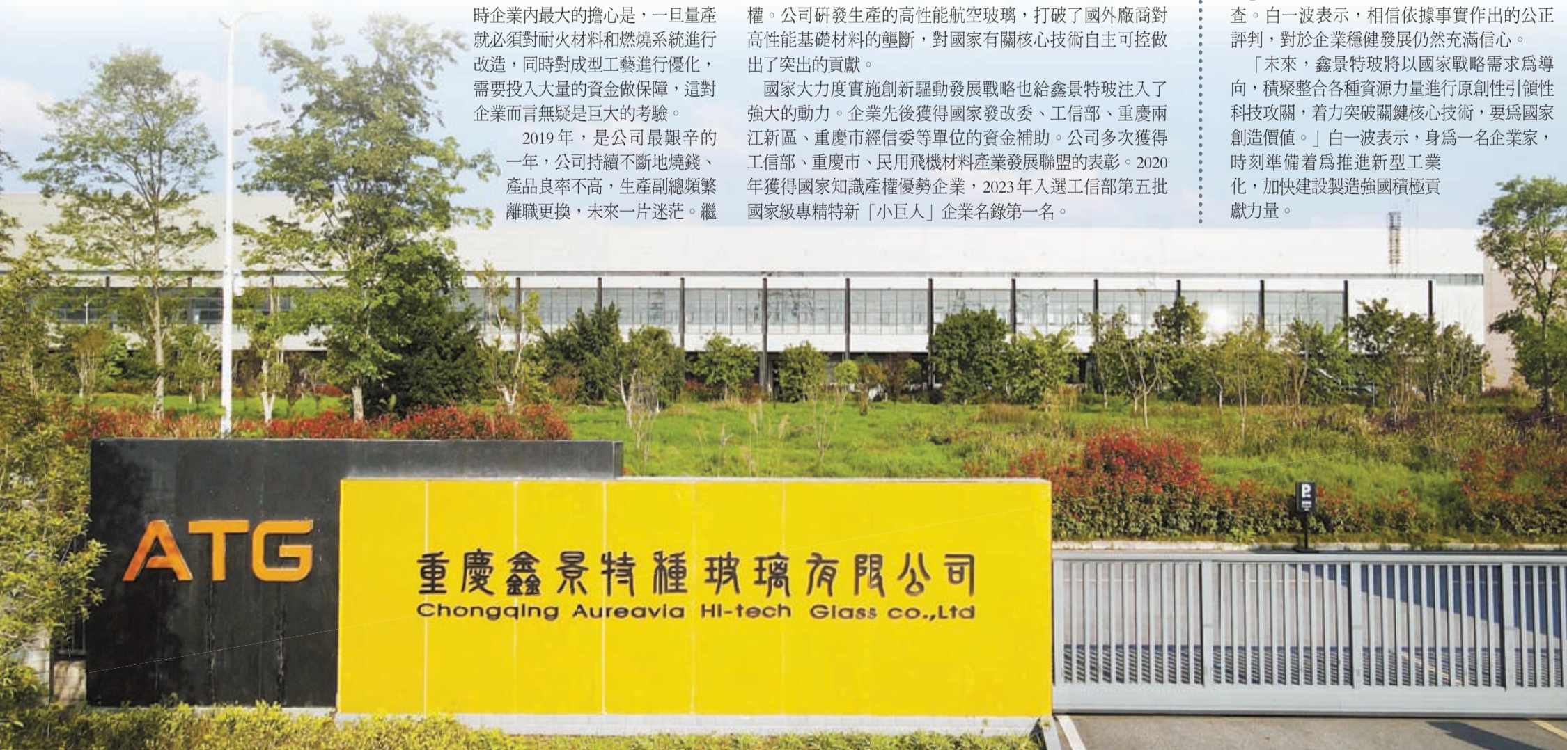
▼鑫景特玻現代化廠房。