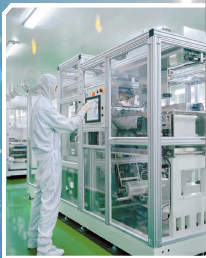
▲達利凱普智能生產線。