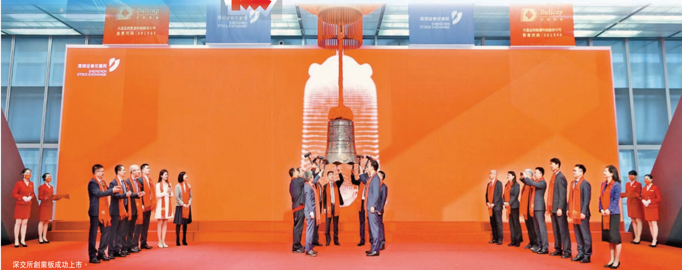
深交所創業板成功上市。

平，快速擴大公司產能、提高供應保障能力，優化快速協同能力，構建起多維化產品快速開發、量產的全球產業鏈技術服務能力。通過上述努力，公司將逐步覆蓋和追趕國外競爭對手，擴大國內外市場佔有率，並促進上游高端基礎材料的國產化進程，為中國基礎電子元器件的保障能力和自主可控水平提升做出卓越貢獻。