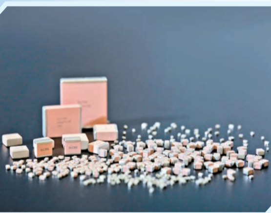
▲▼自主知識產權的國家級單項冠軍產品——射頻微波 MLCC。

通過多年的技術沉澱，公司攻克多項關鍵核心技術，實現了核心電子元器件自主可控。公司擁有陶瓷材料和電子元件兩項體系技術，以及完整的研發、生產、檢驗技術平台和先進設備。公司承擔多項國家及省市級科技重大課題任務，科研成果及核心產品先後榮獲中國創新創業大賽電子信息成長組第一名、國家級製造業單項冠軍產品、中國電子元器件行業協會科技進步一等獎等；公司榮獲國家級專精特新重點「小巨人」企業、國家知識產權優勢企業、首屆遼寧省瞪羚企業、遼寧省省長質量獎等諸多殊榮。