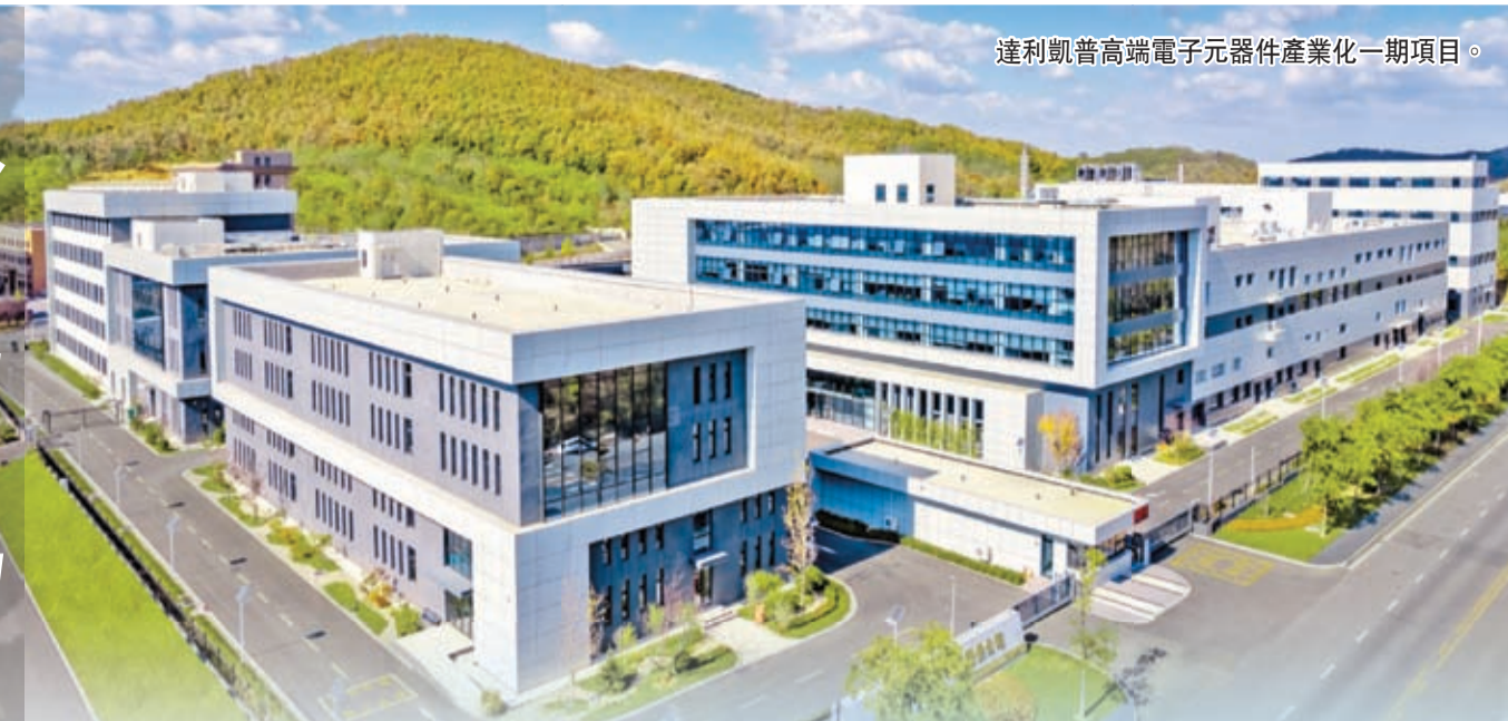
達利凱普高端電子元器件產業化一期項目。