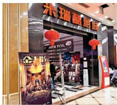
◆元旦賀歲檔中，《金手指》上映首日排映超7.45萬場。圖為影城門口《金手指》海報。

以暑期檔為例，今年憑借206億元的票房成為「史上最強」暑期檔，分別收穫38.47億元、35.23億元票房的《孤注一擲》和《消失的她》，以及《八角籠中》《熱烈》《茶啊二中》等影片都是中小成本電影，從各個方面彰顯着創作者的創造力，在這些作品百花齊放的態勢下，暑期檔有52.7%的觀眾是今年第一次走進電影院，這種「拉新」能力對中國電影市場持續健康的發展意義深遠。