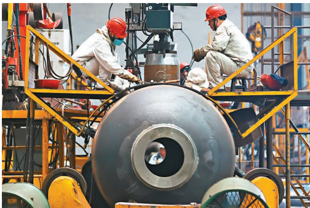
◆2023年12月份製造業PMI中，生產指數為50.2%，比上月下降0.5個百分點，仍高於臨界點，製造業企業生產連續七個月保持擴張。圖為江蘇南通一企業，工人在工作中。

香港文匯報訊（記者 海巖 北京報道）中國國家統計局1日公布，受部分基礎原材料行業進入生產淡季疊加市場需求收縮等因素影響，2023年12月中國製造業採購經理指數（PMI）降至49%，低於11月0.4個百分點，並列為2023年內最低。國家統計局表示，海外訂單減少疊加國內有效需求不足是企業面臨的主要困難。專家預計，隨着增發國債在新年投入使用、保障房等「三大工程」啟動以及海外庫存低位對應的出口企穩，2024年經濟會逐步回升向好。