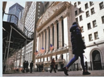
◆大行報告之間的差異，反映美經濟存在巨大的不確定性。資料圖片

觀點，就是認為最糟糕的時期已經過去，例如大摩形容當前是美國經濟困難期的「最後一里路」，高盛也說「最困難的部分已經過去了」。