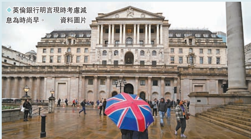
◆英倫銀行明言現時考慮減息為時尚早。資料圖片

鮑威爾於12月中的議息會議後表明，聯儲局不一定要等到通脹回落至2%才減息，言論一出，市場對聯儲局明年減息的預期大幅升溫，分析員甚至普遍預期聯儲局最快在3月就會減息，而且全年將會合共減息3次，合共減息0.75厘，並且可能在2025年再減息1厘。