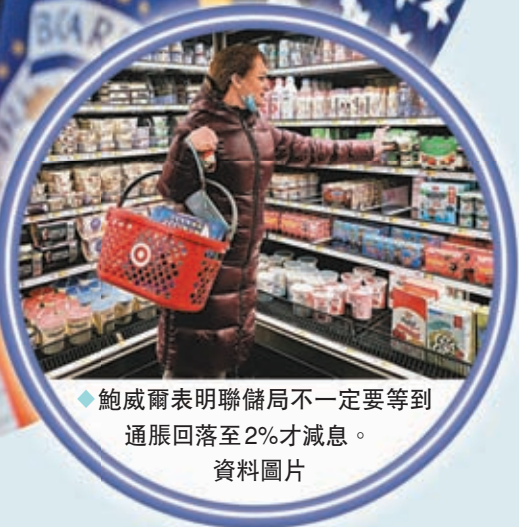
◆鮑威爾表明聯儲局不一定要等到通脹回落至2%才減息。資料圖片