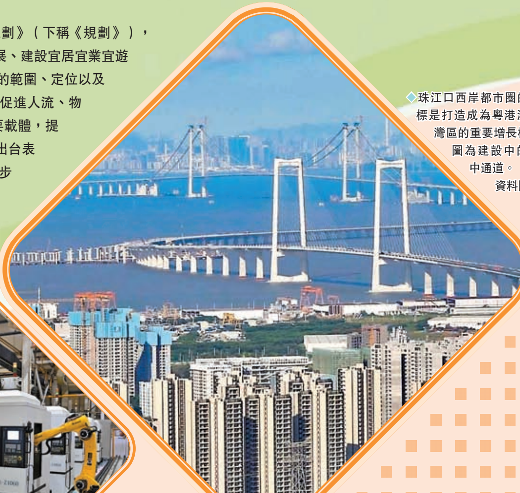
◆珠江口西岸都市圈的目標是打造成為粵港澳大灣區的重要增長極。圖為建設中的深中通道。資料圖片