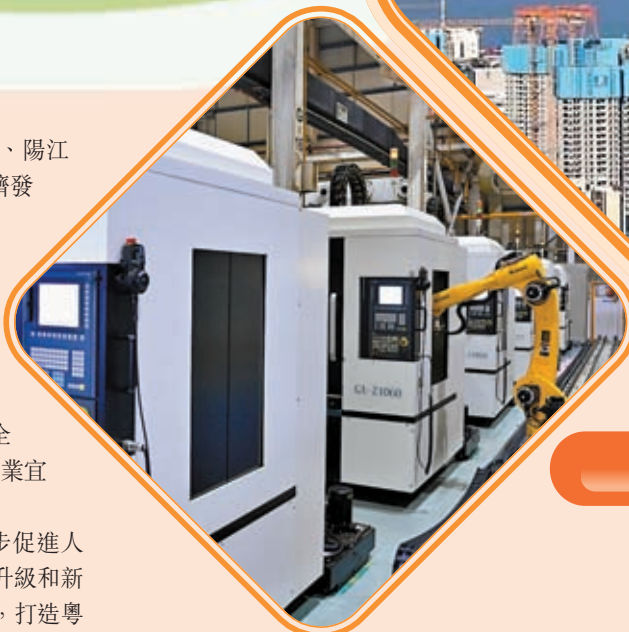
◆珠江口西岸都市圈將打造成具有全球影響力的先進裝備製造基地。圖為珠海格力電器自動化生產線。

《規劃》明確要求推進都市圈公共旅遊碼頭建設，發展遊艇旅遊，依法開闢國際、國內航線，與廣深港澳等打造「一程多站」一體化郵輪旅遊線路。在創新發展機場航空服務產品方面，支持發展與旅遊業相適應的低空飛行服務，包括優化跨境直飛機服務，以珠海橫琴、中山翠亨新區、江門大廣海灣經濟區為試點率先開放低空空域，在與港澳協調一致的情況下探索發展覆蓋港澳的低空飛行觀光旅遊業務，研究開通對接港澳的跨境直飛機服務。