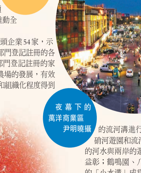
夜幕下的萬洋商業區 尹明曉攝