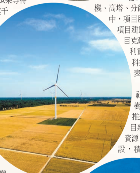
麥田裏的「豐」景