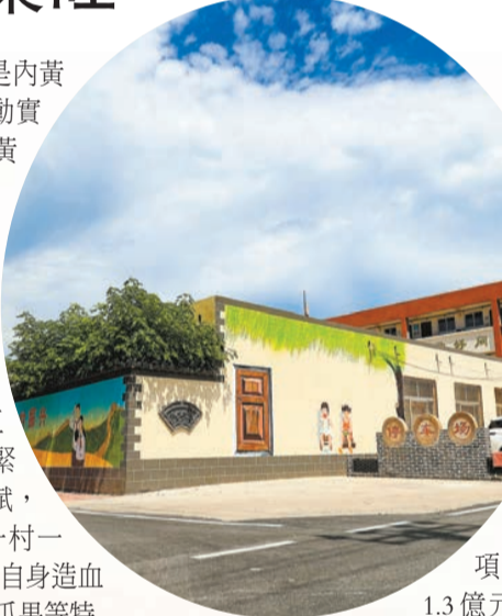
內黃縣後河鎮桑村乾淨整潔的街道。

目前，全縣已有市級以上農業產業化龍頭企業54家，示範合作社、家庭農場137家；在市場監管部門登記註冊的各類農民專業合作社2236家；在市場監管部門登記註冊的家庭農場447家。龍頭企業、合作社及家庭農場的發展，有效推動了結構調整，農業生產經營的集約化和組織化程度得到大大提高，促進了農業增效、農民增收。