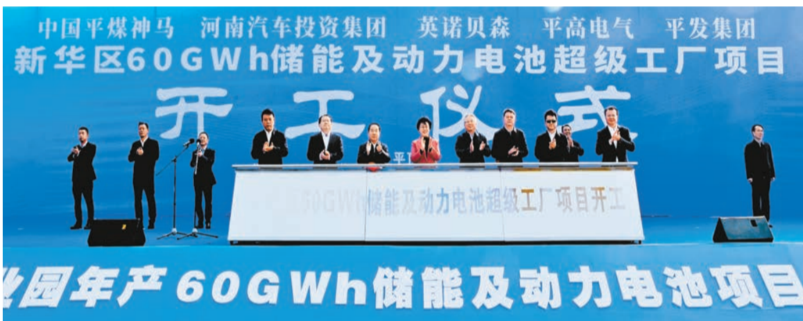
中國平煤神馬 河南汽車投資集團 英諾貝森 平高電氣 平發集團 新華區60GWh儲能及動力電池超級工廠項目 開工儀式