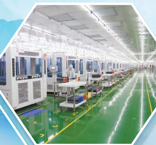
▲生產製造技術行業領先的高效率單晶硅電池生產線。

近年來，中國平煤神馬集團聚焦「集團做強、板塊做實、基層做優」戰略，秉承「合規、賦能、協同」上市公司運營理念，以「融、投、管、退」資本全生命周期管理為主線，通過直接融資、上市培育、投資創利、併購重組等途徑，加快資產資本化、資本證券化，推動資本和實業雙輪驅動、兩翼共振。