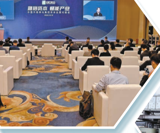
◀集團在上海舉辦資本運營對接會。