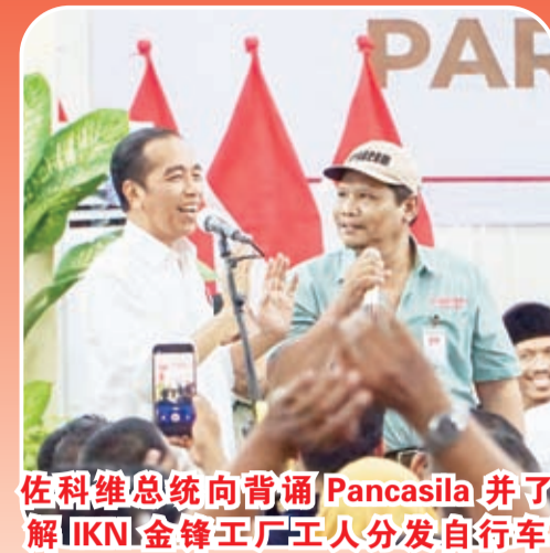
佐科维总统向背诵 Pancasila 并了解 IKNI 金锋工厂工人分发自行车