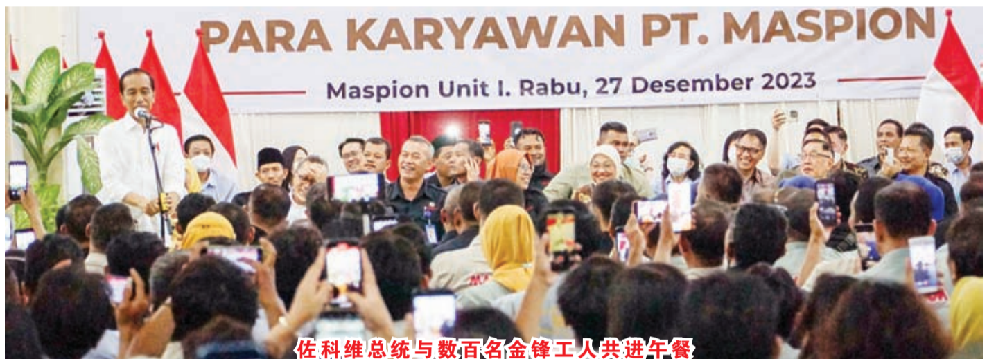
佐科维总统与数百名金锋工人共进午餐