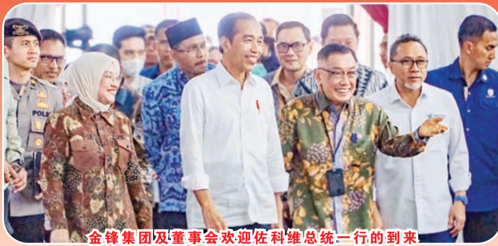
金锋集团及董事会欢迎佐科维总统一行的到来