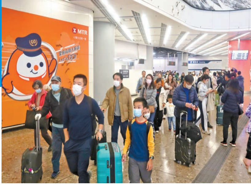
聖誕長假期昨日是最後一天，西九高鐵站出現回港人潮。