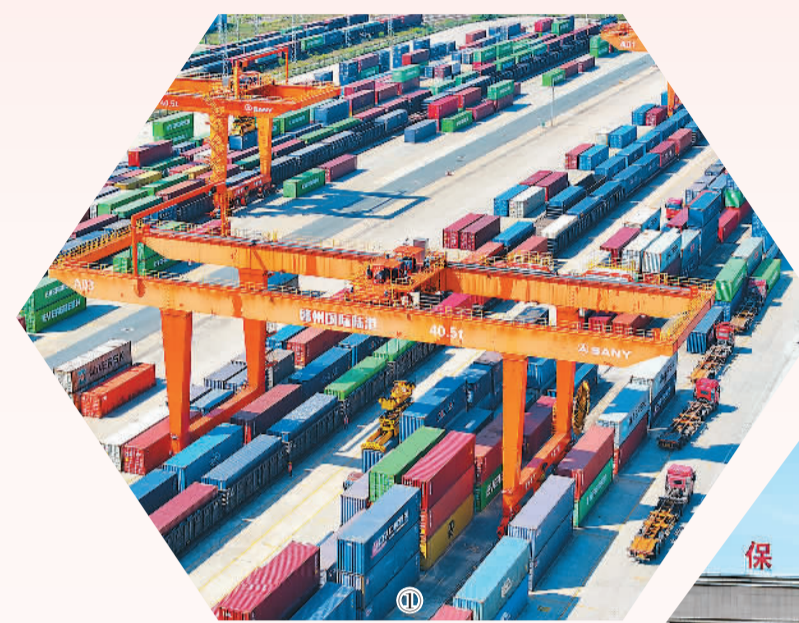
图①：江西赣州国际陆港采取“铁海联运”方式，助力出口“新三样”产品之一的新能源汽车加速“出海”。图为日前在赣州国际陆港货运站，吊装设备装运出口海外的新能源汽车货箱。

在上海虹桥商务区，跨境发债、跨境并购等服务为企业带来极大便利；在北京顺义天竺综合保税区，首家在京设立分支机构的外国演出经纪公司坐落于此，标志着文化领域进一步对外开放……2015年至今，中国已有11个国家