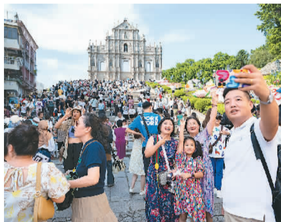
图为游客在澳门大三巴牌坊前游览。新华社记者 张金加摄

随着今年年初内地与港澳人员往来全面恢复，粤港澳大湾区人流、物流日渐繁盛。一年来，粤港澳合作更加深入，大湾区建设迎来“加速期”。