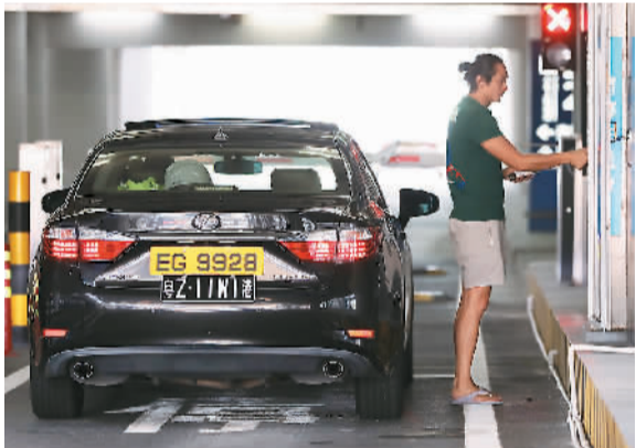
图为香港司机在港珠澳大桥珠海公路口岸使用“一站式”通道驾车通关。