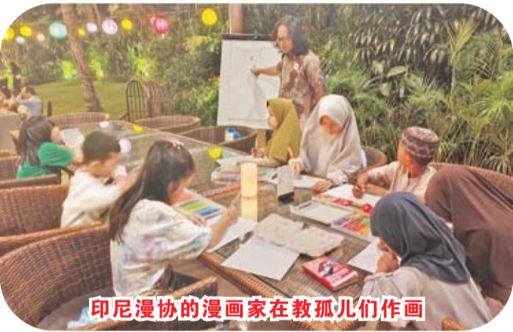
印尼漫协的漫画家在教孤儿们作画