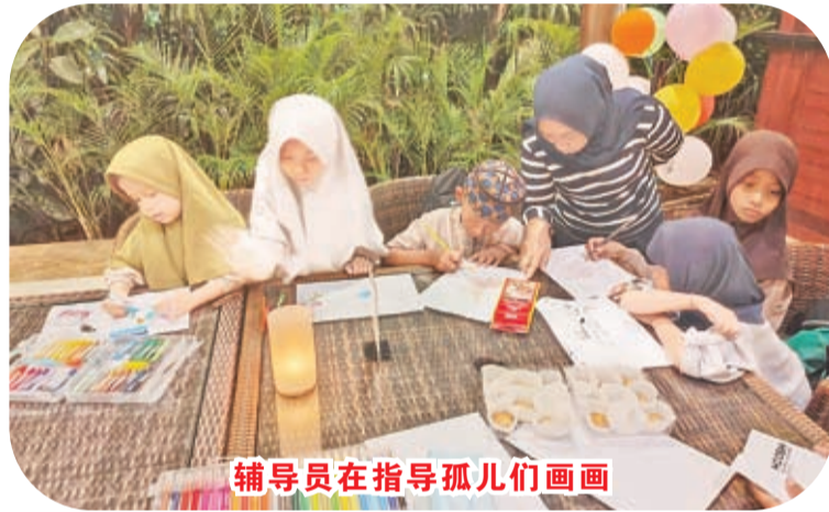
辅导员在指导孤儿们画画