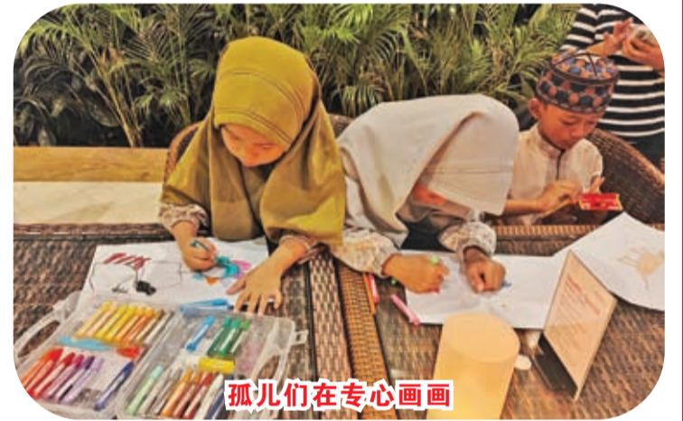
孤儿们在专心画画