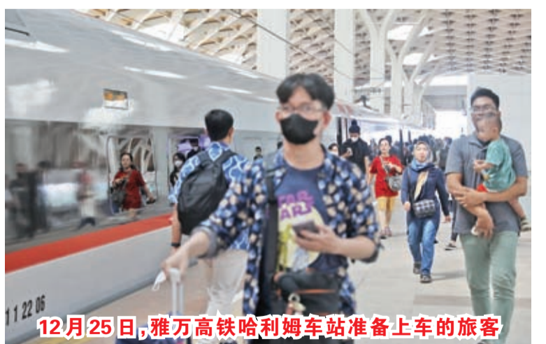
12月25日，雅万高铁哈利姆车站准备上车的旅客

中新社雅加达12月25日电(记者李志全图文报道)记者25日从中国铁路国际有限公司获悉，截至12月24日，雅万高铁累计发送旅客突破100万人次。