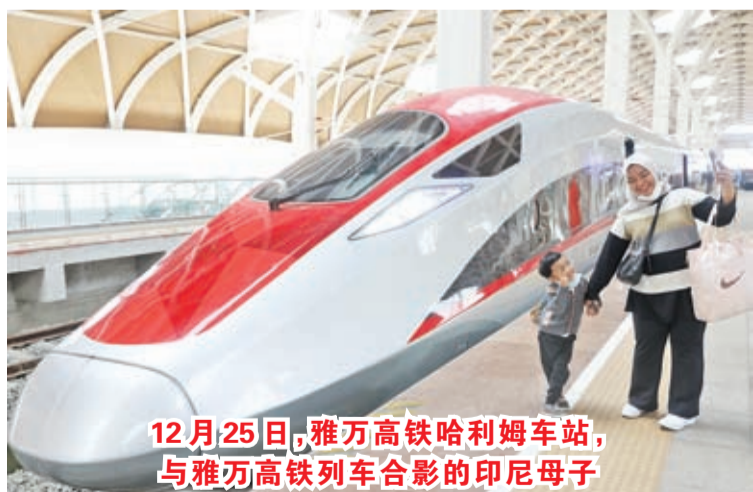
12月25日，雅万高铁哈利姆车站，与雅万高铁列车合影的印尼母子