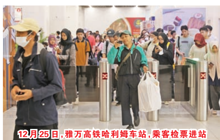
12月25日，雅万高铁哈利姆车站，乘客检票进站

据了解，12月份印尼当地公共假期较为集中。23日，恰逢印尼当地公共假日和周末重叠，位于雅加达的哈利姆车站客流激增。为了保障旅客高效舒适乘车，