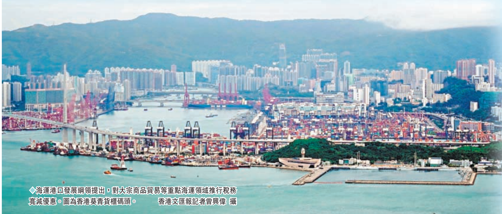
◆海運港口發展綱領提出，對大宗貨物貿易等重點海運領域推行稅務寬減優惠。圖為香港葵青貨櫃碼頭。

香港擁有天然深水海港，又位於航路要道，香港港口曾長期在全球貨櫃港中穩居首位，惟近年鄰近地區港口迅速崛起，香港港口的排名去年就跌至全球第九名。為強化香港海運及港口的競爭力，香港特區政府20日公布《海運及港口發展策略行動綱領》，制定四大方向、十大策略和32項具體行動措施。明年起，特區政府會對大宗貨物貿易等重點海運領域推行稅務寬減優惠，並檢討現行稅務寬減措施，研究引入新的稅務扣減安排，取代船舶租賃制度下兩成的寬減稅基優惠，同時開拓東盟、「一帶一路」沿線國家的新興市場，以支持香港海運及港口業的持續發展需要，加速推進綠色智慧港口和航運，鞏固和提升作為國際航運中心的地位。